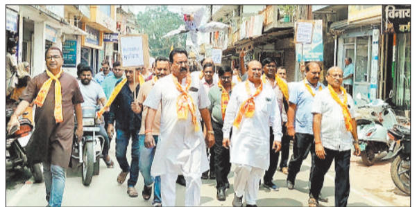
रैली निकालकर थाना जाते अग्रवाल समाज के सदस्य।