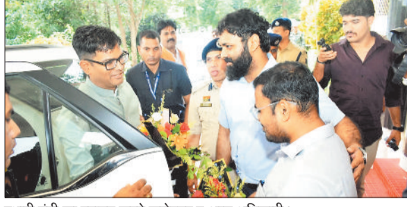
प्रभारी मंत्री का स्वागत करते कलेक्टर व अन्य अधिकारी।

पीएम जनमन योजना, धरती आबा ग्राम उत्थान योजना द्वारा इन क्षेत्रों का समन्वित विकास किया जाना है। योजना-नगरीय किये जा रहे कार्यों में गुणवत्ता का विशेष ध्यान रखने और कर्मठता के साथ प्रत्येक कार्यों को समय सीमा में पूर्ण करने के निर्देश दिए। उन्होंने जनप्रतिनिधियों और अधिकारियों को आपस में चर्चा कर समन्वय के साथ काम करने की अपील भी की। उन्होंने जिले में पर्यटन को बढ़ावा देने के लिए दनगरी जलप्रपात पहुंच मार्ग सहित अन्य आवश्यक निर्माण कार्यों जल्द से जल्द पूरा कराने का कहा। उन्होंने सभी निर्माण कार्य कराने वाले विभागों की समीक्षा कर कहा कि जशपुर एक आदिम बहुल जिला होने के साथ मुख्यमंत्री श्री विष्णुदेव साय का गृह जिला भी है इसे हमें एक मॉडल के रूप में विकसित ►► शेष पेज 4 पर