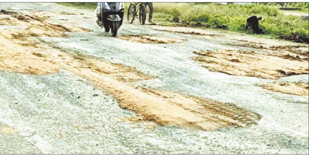
गड्ढों में भरे गए मिट्टी।

रामानुजगंज से बलरामपुर तक राष्ट्रीय राजमार्ग-343 के निर्माण कार्य की प्रक्रिया जल्द शुरू होने वाली है। निर्माण कार्य से पहले सड़क को यातायात योग्य बनाए रखने के लिए शासन द्वारा करीब 3 करोड़ रुपए की राशि स्वीकृत की गई है जिससे आवश्यक मरम्मत कार्य किया जा सके। वर्तमान में सड़क के काफी जर्जर और जगह-जगह बड़े-बड़े गड्ढे हो जाने से यात्री बस सहित छोटे वाहन एवं बाइक स्कूटी से आवागमन करना काफी कठिन हो गया है। ऐसे में सड़क मरम्मत से पूर्व जर्जर सड़क को यातायात योग्य बनाने गड्ढों को पाटा जा रहा है। इस मरम्मत में भी भारी लापरवाही बरती जा रही है। गड्ढों में मिट्टी