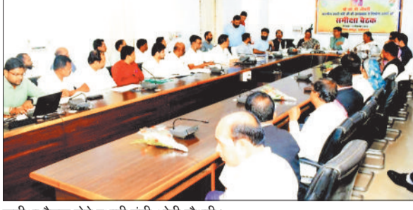
समीक्षा बैठक लेते प्रभारी मंत्री ओपी चौधरी।

हरिभूमि न्यूज ►► जशपुरनगर वित्त मंत्री एवं जिले के प्रभारी मंत्री ओपी चौधरी की अध्यक्षता में गुरुवार को जिले में निर्माण एजेंसियों की बैठक के दौरान विचार-विमर्श के माध्यम से प्रभारी मंत्री श्री चौधरी ने वित्तीय वर्ष 2024-25 एवं 2025-26 के बजट में स्वीकृत, प्रगतिरत एवं अप्रारम्भ कार्यों की जानकारी सभी विभागों से ली। उन्होंने जशपुर में पीएम जनमन योजना-नगरीय किये जा रहे कार्यों की जानकारी लेते हुए इन्हें प्राथमिकता से पूर्ण कराने के निर्देश दिए। उन्होंने कहा कि जिले के सुदूर वनांचलों में विकास करना शासन का लक्ष्य है,