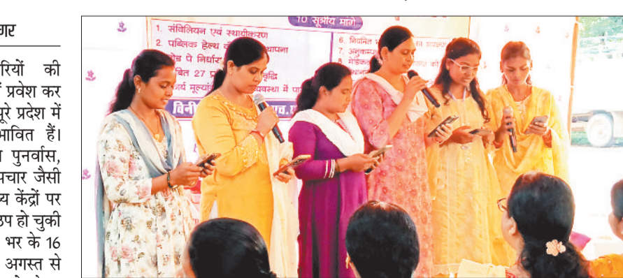
गीत गाकर विरोध जताते एनएचएम महिला कर्मचारी।

राष्ट्रीय स्वास्थ्य मिशन कर्मचारियों की अनिश्चितकालीन हड़ताल 25वें दिन में प्रवेश कर गई। हड़ताल के चलते जिले सहित पूरे प्रदेश में स्वास्थ्य सेवाएं पूरी तरह से प्रभावित हैं। टीकाकरण, टीबी-कुष्ठ जांच, पोषण पुनर्वास, महामारी नियंत्रण, गैर-संचारी रोग उपचार जैसी योजनाएं तथा प्राथमिक व उप स्वास्थ्य केंद्रों पर मिलने वाली बुनियादी सेवाएं लगभग ठप हो चुकी हैं। जिले के 845 कर्मचारी और प्रदेश भर के 16 हजार से अधिक एनएचएम कर्मी 18 अगस्त से नियमितौरण सहित 10 सूत्रीय मांगों को लेकर हड़ताल पर हैं। स्वास्थ्य संस्थाएं वर्षों से एनएचएम कर्मचारियों पर ही निर्भर रही हैं, इसलिए आमजनों को अब उपचार के लिए निजी अस्पतालों का सहारा लेना पड़ रहा है। ग्रामीण अंचलों में स्थिति और भी गंभीर बनी हुई है।