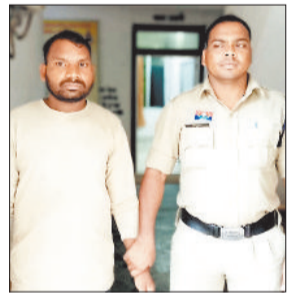
पुलिस गिरफ्त में आरोपी।

जशपुरनगर। जिले के थाना बगीचा क्षेत्र में एक विधवा महिला के साथ लंबे समय तक शादी का झांसा देकर दुष्कर्म करने वाले आरोपी को पुलिस ने गिरफ्तार कर न्यायिक रिमांड पर जेल भेजा। इस मामले ने महिला सुरक्षा और संवेदनशीलता पर नए प्रश्न खड़े किए हैं।