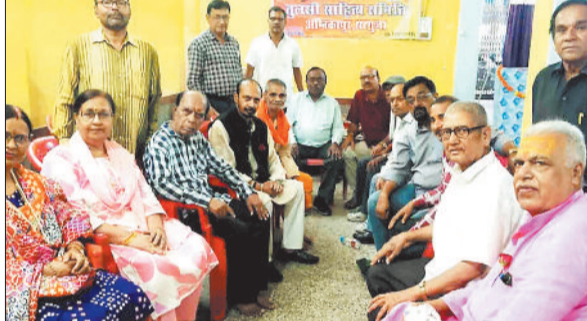
काव्यगोष्ठी में शामिल कवी।