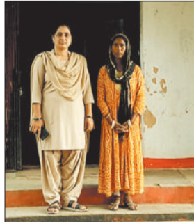
आरोपी महिला पुलिस गिरफ्त में।

जशपुरनगर। जिले के थाना बगीचा क्षेत्र से गुम हुई 14 वर्षीय नाबालिग बच्चों की बरामदगी ने न केवल परिजनों की चिंता को समाप्त किया बल्कि जिले के लोगों में पुलिस की तत्परता और संवेदनशीलता को लेकर विश्वास भी बढ़ाया। पुलिस की विशेष टीम द्वारा संचालित "ऑपरेशन मुस्कान" के तहत बच्चों को उत्तर प्रदेश के ग्राम अर्दा से सकुशल बरामद कर परिजनों को सौंपा गया।